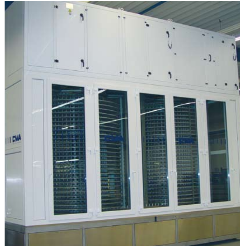
Das Kühlaggregat wird je nach Platzverhältnissen und Anforderung vor, zwischen oder oberhalb der Kühlschlangen verbaut.

Die Kühlleistung lässt sich problemlos auf das jeweilige Produkt einstellen. Bei schwankender Produktmenge wird sie automatisch angepasst.