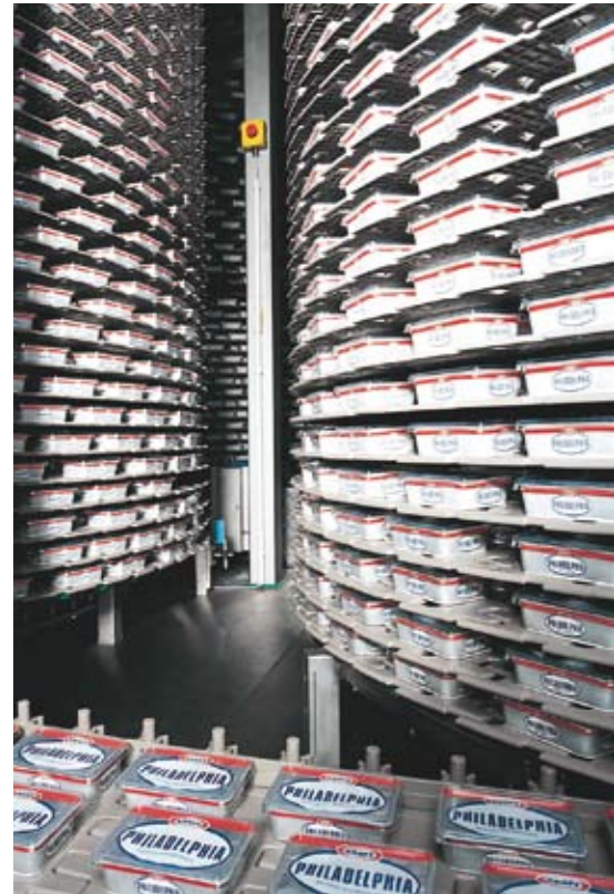
Der HELIFLEX-Durchlaufkühler zeichnet sich durch die kompakte, geschlossene Bauweise aus.